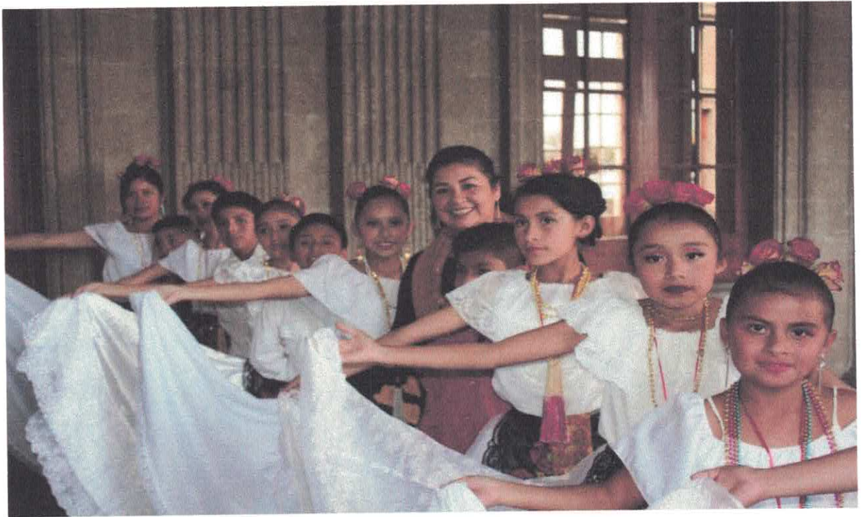
Graduación de según da generación de alumnos egresados de la Escuela de Iniciación Artística